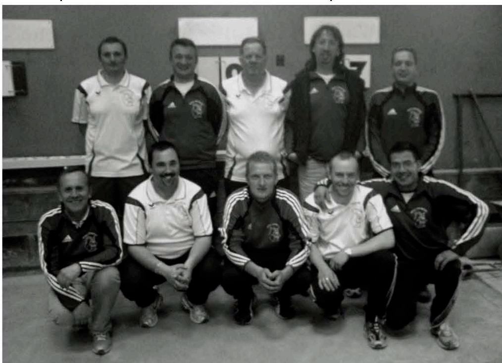
Equipe du championnat des clubs année 2007-2008

La boule vocançoise est bien représentée dans les compétitions régionales et en particulier dans les championnats des clubs 3° et 4° division puisque cela fait plusieurs années que le club perd en quart voir en demie finale de cette compétition.